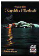
I Capuleti ed i Montecchi

(Les Capulets et les Montaigus) opéra de Vincenzo Bellini - 1830.