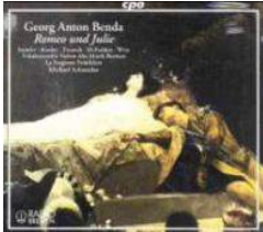
Romeo und Julie de Georg Benda – 1776

Il existe plus d'une vingtaine d'opéras qui conte l'histoire malheureuse de Roméo et Juliette, en voici 3 :