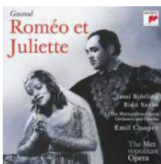
Roméo et Juliette par Charles Gounod - 1867