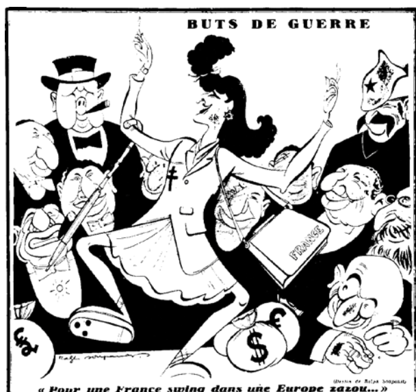
« Je suis partout », 6 juin 1942

Le milieu des années 1930 fut particulièrement riche en bouleversements.