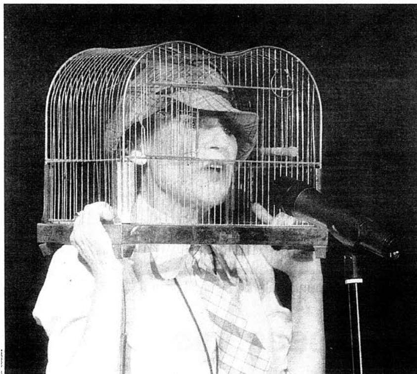
Trenet et la folie Dogskin : un régal !

Montfort sur Argens. Le 12 ème festival des Nuits du Château s'est terminé en fanfare.